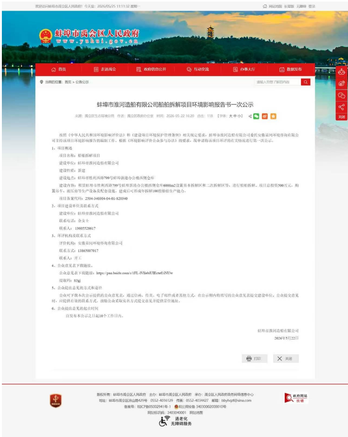
图2-1 第一次网络公示截图