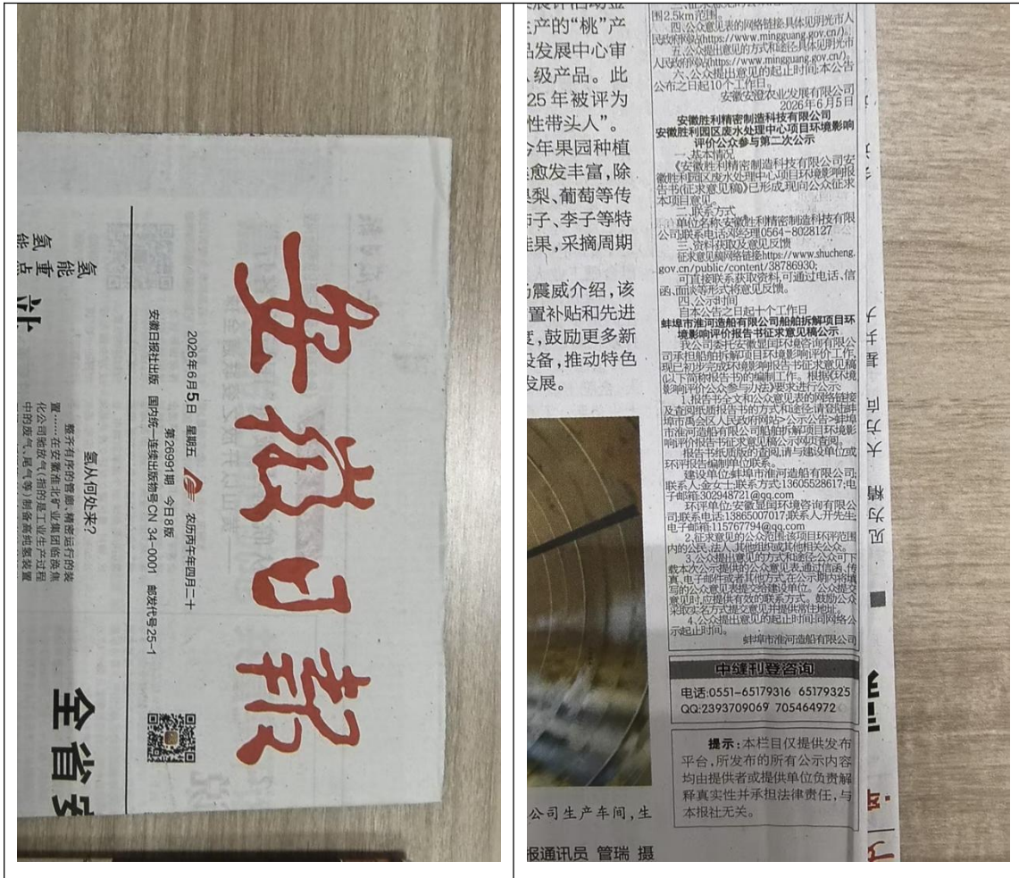
图 3-3 第二次报纸公示截图