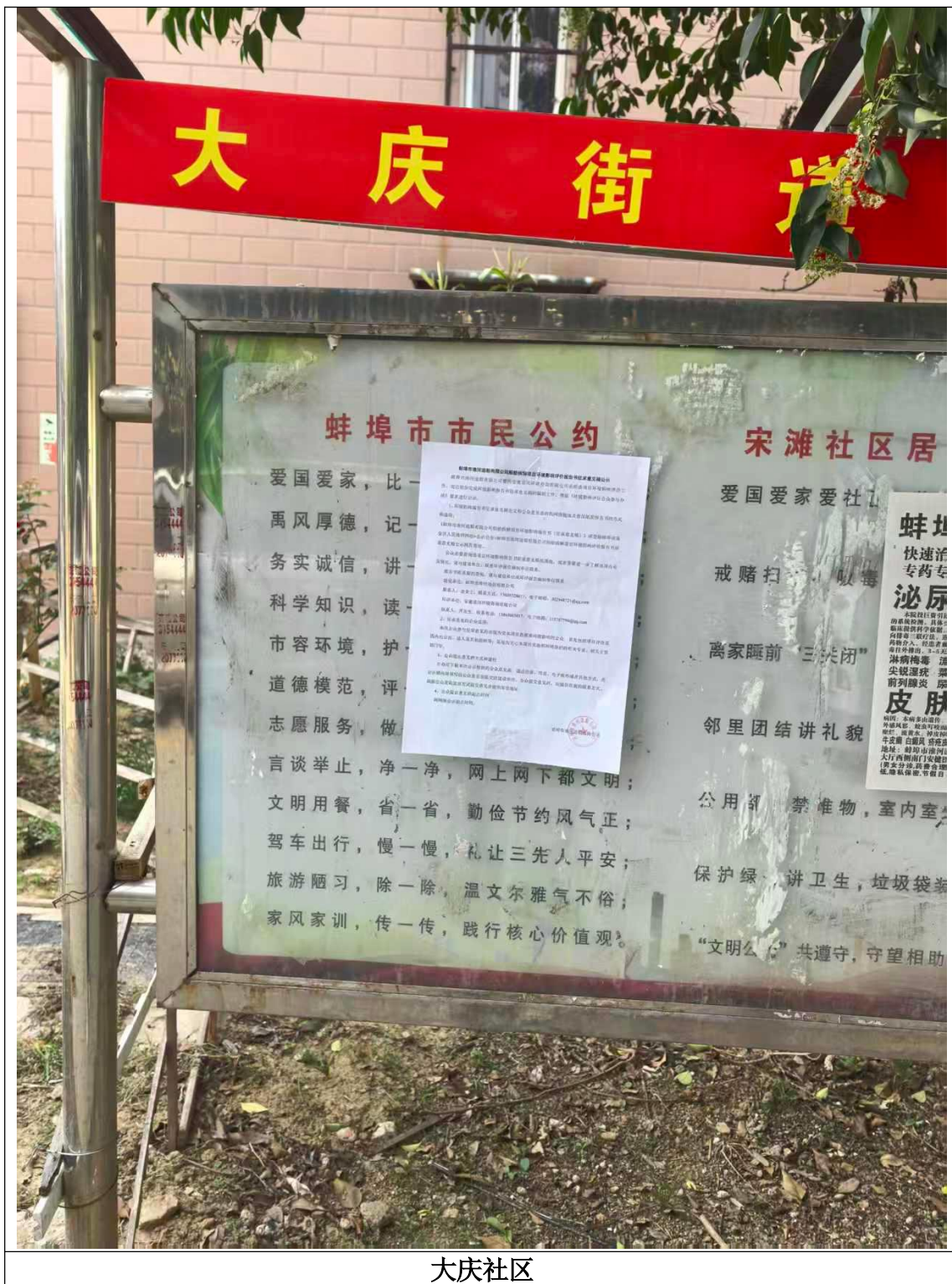
大庆社区 图 3-4 张贴公告