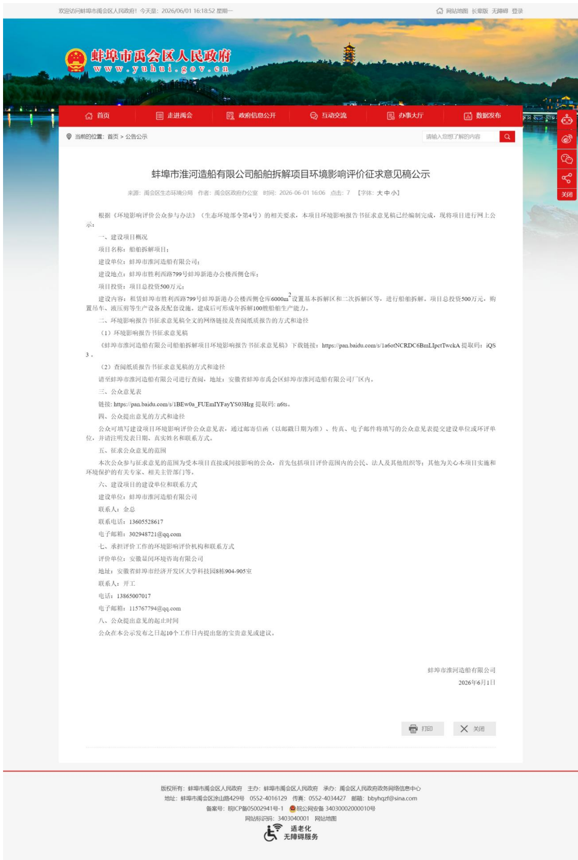
图 3-1 第二次网络公示截图